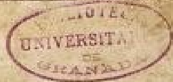
Regimen sanitatis Salernitanum/cum expositione Arnaldi de Villa Nova. Venecia, [1500?]. Universidad de Granada, BHR/Caja C-034 (1) Perg.