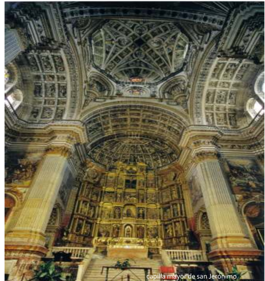
capilla mayor de san Jerónimo

que no sigue los cánones de la fe medieval, y se niega a reflejar valores anticuados.