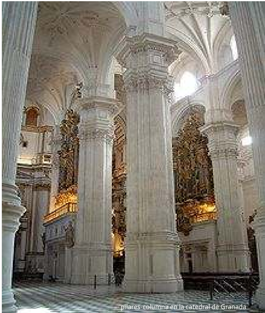
pilares-columna en la catedral de Granada

Es un ensayo de renovación que, sin embargo, no tuvo futuro ni consecuencia, ya que la brutalidad de la Reforma obligaría al catolicismo a buscar otras fórmulas que aplicar. La concepción espacial de esta iglesia se basa en la aplicación de unos presupuestos constructivos y estéticos muy avanzados: se trata de una iglesia-salón de nave única, con crucero de escaso desarrollo. En la elevación total de las naves reconoceremos ese innato sentido de la grandeza de Siloé, y si por una parte la nave va recubierta de una bóveda de medio punto, el crucero se cubre con una bóveda rebajada con nervaduras, exponiendo todo el conjunto una sintaxis clásica, con predominio del blanco en los paramentos y del oro en las molduras. El estilo romano que tan magistralmente dominaría Siloé, vino a liberar al artista de los modos platerescos que le habían inspirado la Escalera Dorada de la Catedral de Burgos. El Siloé renacentista no se limita a la correcta aplicación de los órdenes clásicos, copiando los antiguos monumentos de Roma, va más allá haciendo una verdadera superación del estilo, con ejemplos como el concurso para la torre de la iglesia de Santa María del Campo y, fundamentalmente, la iglesia del monasterio de San Jerónimo de Granada, verdadero banco de pruebas de la fábrica de la catedral granadina.