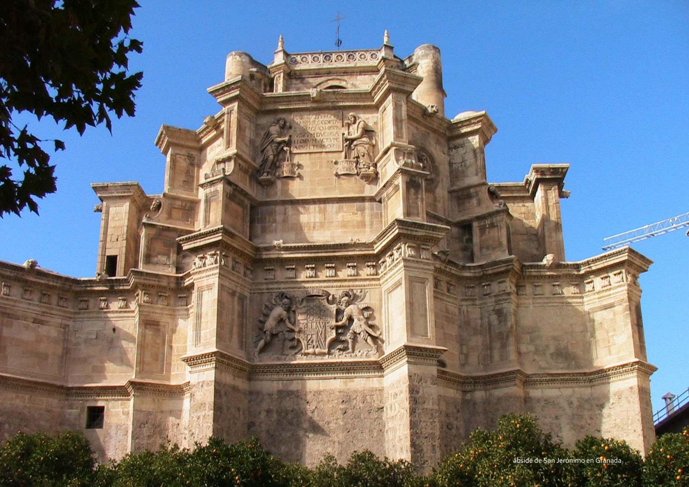
ábside de San Jerónimo en Granada