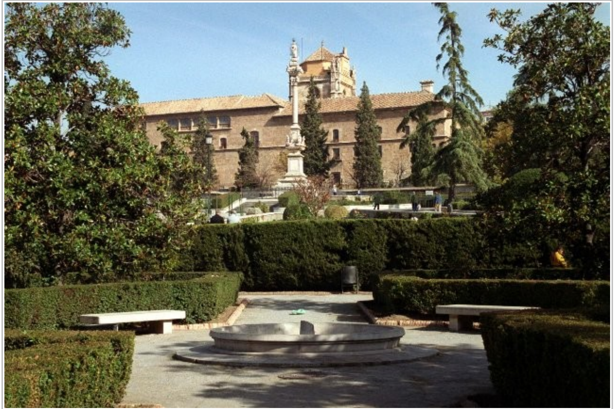
El Hospital Real y el monumento al Triunfo

El otro expediente a que aludíamos y cuya reproducción exponemos como documento del mes, está relacionado con esta fábrica de tejer. Incluido en la misma serie documental que el anterior. Está fechado en 1766, durante la presidencia de Fernando José de Velasco, y se recoge en el resumen de su presidencia, dentro del apartado de las diferentes Comisiones que la Chancillería tenía afectas al margen de su función como tribunal. El expediente trata sobre el proyecto de ampliación de la gama de tejidos que se fabricaban en el Hospicio, con objeto de realizar nuevas piezas que fuesen válidas para fabricar las velas de los barcos de la Real Marina. Primero hace un resumen en forma de relato de todo el proceso de intercambio de correspondencia y muestras de tejidos con la fábrica establecida en Cádiz, y con las demás instancias implicadas, entre ellas el Consejo real. Al final del resumen, se añade cada una de las cartas y documentos originales generados en el proceso.