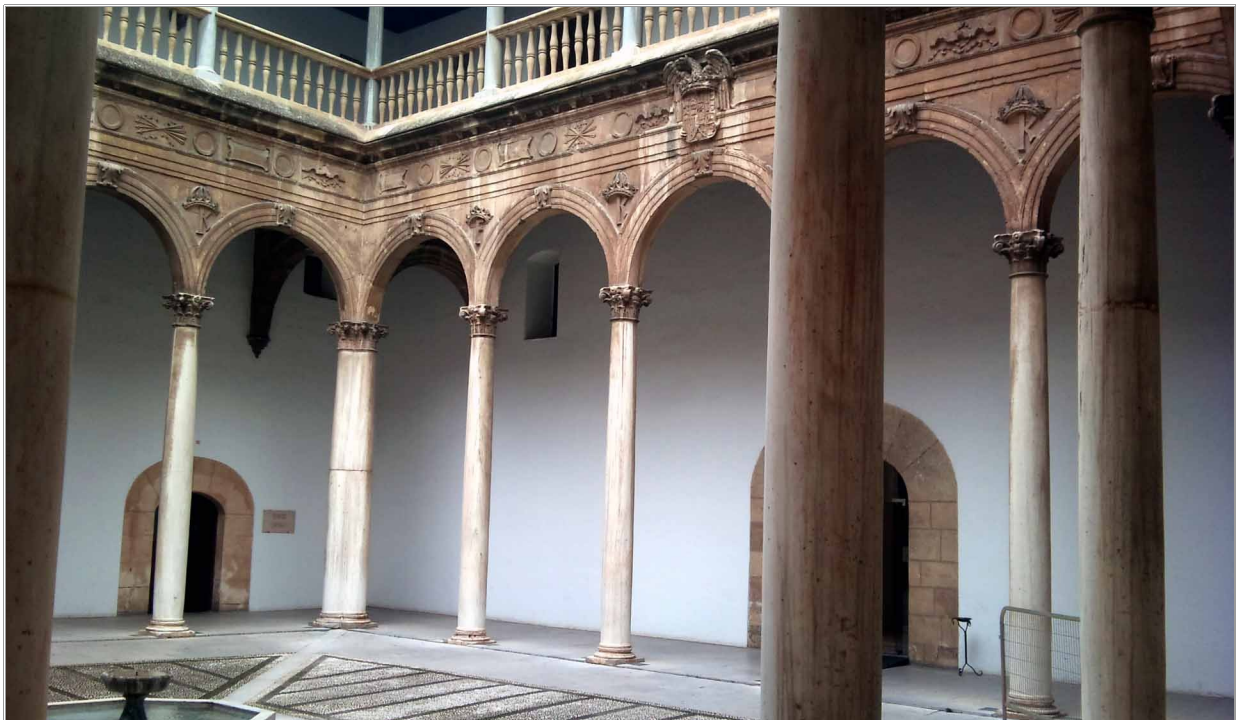
Patio de los mármoles del Hospital Real

La relación se inició en 1511, año en que comenzó la construcción del hospital y de la fecha de la real cédula que nombraba a su oidor más antiguo, al capellán mayor de la Capilla Real, al prior del Monasterio de San Jerónimo y a un caballero veinticuatro de Granada, visitantes y administradores del hospital.