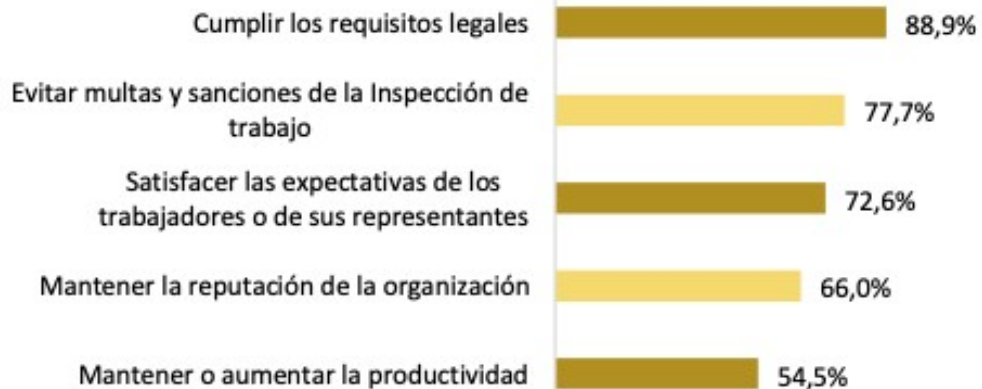
Gráfico 15. Motivación de las empresas entrevistadas para gestión riesgos laborales.