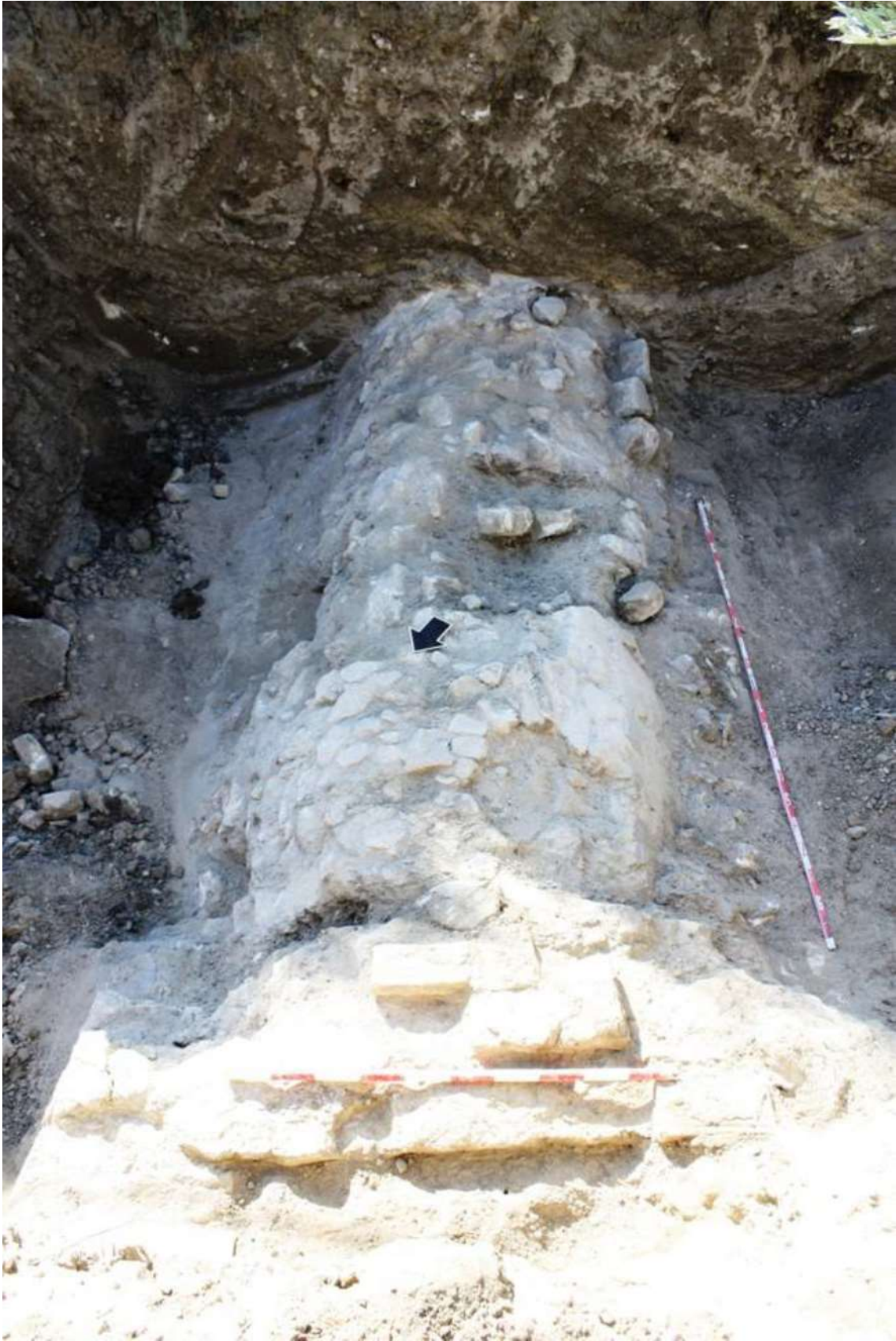
Vista desde el NW de todo el recorrido de la alcantarilla detectado en el Sondeo 5.