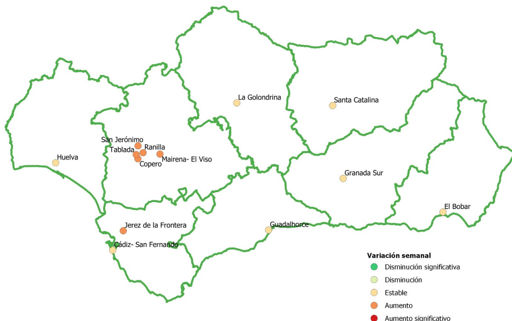
Figura 1. Representación geográfica de los datos de variación en los puntos de muestreo (QGIS 3.16).

Datos Red VATAR (V): El Bobar, Cádiz- San Fernando, Jerez de la Frontera, Granada Sur, Guadalhorce, Huelva y Santa Catalina. Datos Red RAVAR: Copero, Ranilla, San Jerónimo, Tablada y Mairena-El Viso EMASESA; Datos La Golondrina EMACSA.