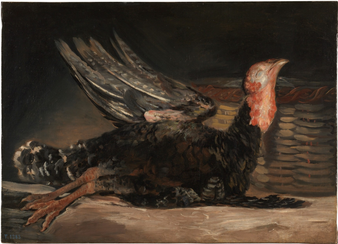
Francisco de Goya y Lucientes, Un pavo muerto y Aves muertas