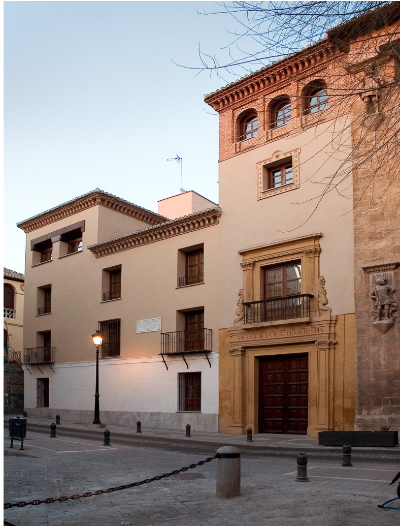
Archivo de la Real Chancillería de Granada