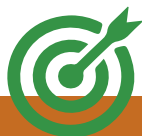
Figura 17. Ejemplo plantilla 6.1.