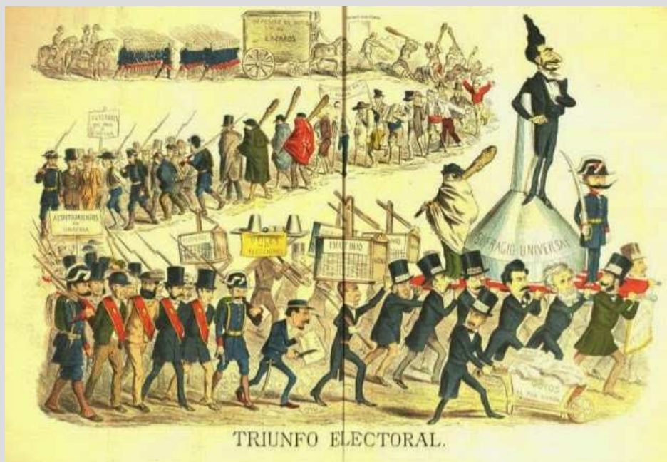
Caricatura satírica del semanario "La Flaca"

A finales de 1875, con la proclamación de Alfonso XII como rey, se instaura de nuevo la monarquía en España y Cánovas del Castillo inicia el proceso restaurador volviendo al sistema anterior al Sexenio. De esta forma, la Ley electoral de 1877 restablece la de 1865 y recupera, con alguna modificación, el sufragio censitario y capacitario. Un año más tarde, la Ley electoral de 1878 , sobre la base de elección por distritos, concede el derecho al voto a todo español mayor de 25 años contribuyente de 25 pesetas anuales por contribución territorial o 50 por subsidio industrial. Se estima que el censo electoral baja a un 5% de la población.