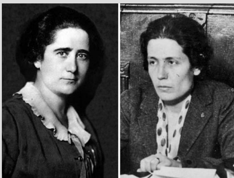
Clara Campoamor y Victoria Kent

En el marco del turno ideado por Sagasta y Cánovas del Castillo, en el que el partido liberal y el conservador se alternaban en el Gobierno, la Ley Electoral de 1890 restablece el sufragio universal masculino. Dicha Ley, promulgada durante el primer gobierno del Partido Liberal de Sagasta, recupera el sufragio universal para todos los varones mayores de 25 años, un 27% de la población. La Ley electoral de 1907 mantiene los mismos requisitos. Durante este período las elecciones españolas apenas tienen influencia ya que el caciquismo y sus redes clientelares contribuirán a una manipulación continua de las mismas. La toma del poder por Primo de Rivera y la implantación de su dictadura en 1923 acaban con este sistema.