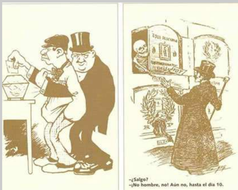
Caricaturas sobre el caciquismo y pucherazo

contrara el alcalde, se procederá al nombramiento de uno nuevo, por lo que ningún concejal será alcalde más de cuatro años, si bien todos podrán ser reelegidos varias veces.