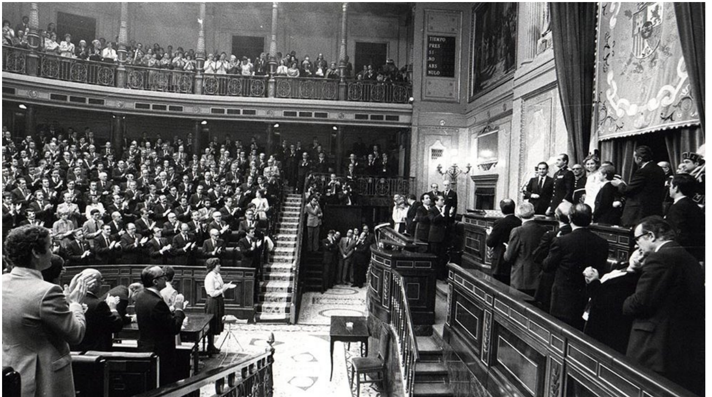
Sesión de apertura del Congreso de la I Legislatura, mayo 1979

Imagen en portada: "Proclamación Constitución de 1812" Salvador Viniegra