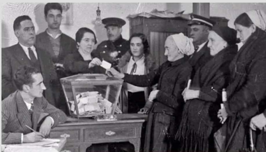
Mujeres votando en 1933

La guerra civil supone un punto de inflexión y tras ella, durante los casi cuarenta años de dictadura, los españoles no pueden participar en unas elecciones democráticas. El nuevo período se inicia con la Ley para la Reforma Política de 1976, según la cual los diputados del Congreso serán elegidos por sufragio universal, directo y secreto de los españoles mayores de edad. Las elecciones generales del 15 de junio de 1977 se celebran ya bajo el marco jurídico del Decreto-Ley 20/1977, sobre Normas Electorales, que determina que serán electores “todos los españoles mayores de edad incluidos en el Censo y que se hallen en pleno uso de sus derechos civiles y políticos”. Reconocimiento, por tanto, del derecho a votar a todos los españoles, hombres y mujeres, de más de 21 años, un 65% de la población total. La Constitución de 1978 , posteriormente, fija la mayoría de edad en los 18 años, con lo que se garantiza el derecho al voto a un 71% de la población española. En la actualidad, la Ley Orgánica del Régimen Electoral General de 1985 regula los pormenores de todos los procesos electorales que se celebran en España. Según los últimos datos, en torno a un 73% de la población española tiene derecho a votar.