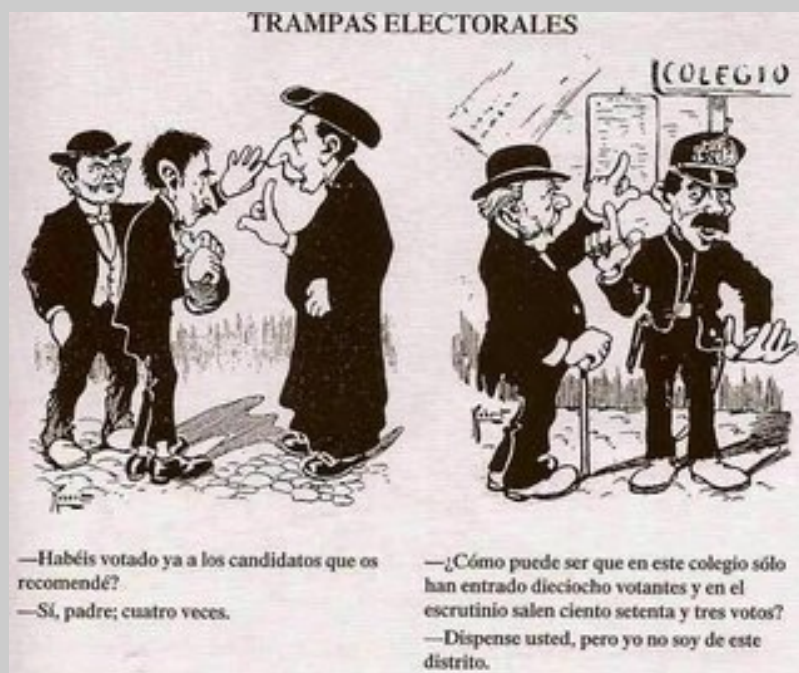
Caricaturas sobre el caciquismo y pucherazo

nombrados por los vecinos, con un modelo de sufragio censitario pero con criterios más aperturistas. Los Ayuntamientos gozarán de amplias atribuciones aunque para algunos aspectos la diputación provincial seguirá ejerciendo su potestad. La vuelta de los moderados en 1856 impone nuevamente la Ley de 1845.