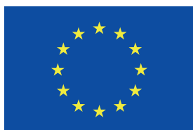
UNIÓN EUROPEA Fondo Europeo Agrícola de Desarrollo Rural

La tipografía utilizada para la composición del logotipo es la «EC Square Sans Pro Bold» para la Unión Europea y «EC Square Sans Pro Regular» para la leyenda del fondo correspondiente. En caso de no disponer de ésta se proponen alternativas como: Verdana, Arial, Tahoma, Calibri y Trebuchet. Unión Europea irá siempre en mayúsculas y el fondo, en minúsculas.