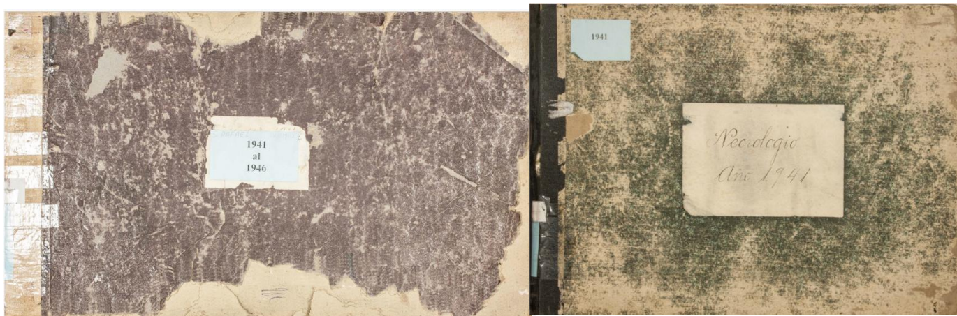
Imágenes de libros de registros del Cementerio de San Rafael

Se ha elaborado un primer listado aunando todas las fuentes disponibles con todos los nombres de las víctimas cuyo paradero fue el Cementerio de San Rafael desde julio de 1936 a enero de 1949 (se adjunta el listado al final de estas páginas). Este primer resultado se está completando con los datos que nos están proporcionando los registros que estamos encontrando en los libros del Cementerio de San Rafael, que es una de las fuentes documentales fundamental para arrojar luz sobre datos identitarios de las víctimas, pero fundamentalmente sobre el paradero final de los restos de los mismos dentro del Cementerio.