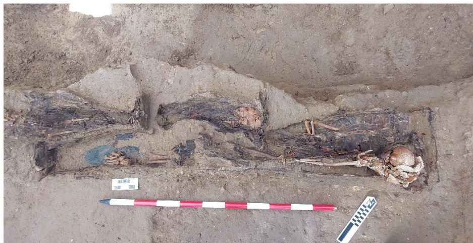
Disposición de tres enterramientos infantiles en ataúd en la Fosa.