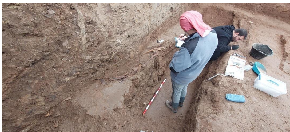
Trabajos de documentación antropológica de campo