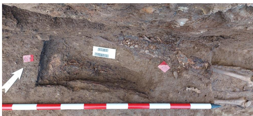
Disposición de 2 enterramientos infantiles en ataúd sobre otro de adulto.

De las inhumaciones de adultos documentadas, han sido exhumados y trasladados al laboratorio los restos de 9 individuos. Todos ellos fueron dispuestos individualmente en su correspondiente ataúd, a excepción de los I-6 y 7 que componían un depósito múltiple, es decir, fueron enterrados a la vez compartiendo superficie de deposición y sedimento de cubrición, aunque individualizados en sus correspondientes ataúdes. 6 de ellos ya se les ha realizado un tratamiento preventivo para su conservación, consistente en la limpieza superficial del sedimento para evitar la proliferación de hongos, así como se ha concluido el estudio preliminar en laboratorio y se ha procedido a su salvaguarda y almacenamiento. El mismo tratamiento han recibido los elementos de cultura material asociados a ellos, en su mayoría relacionados con su indumentaria.