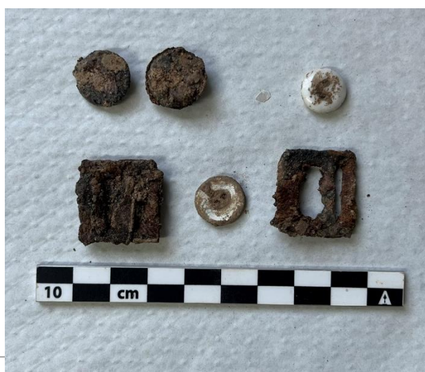
Imágenes de laboratorio del I-1 y objetos asociados.