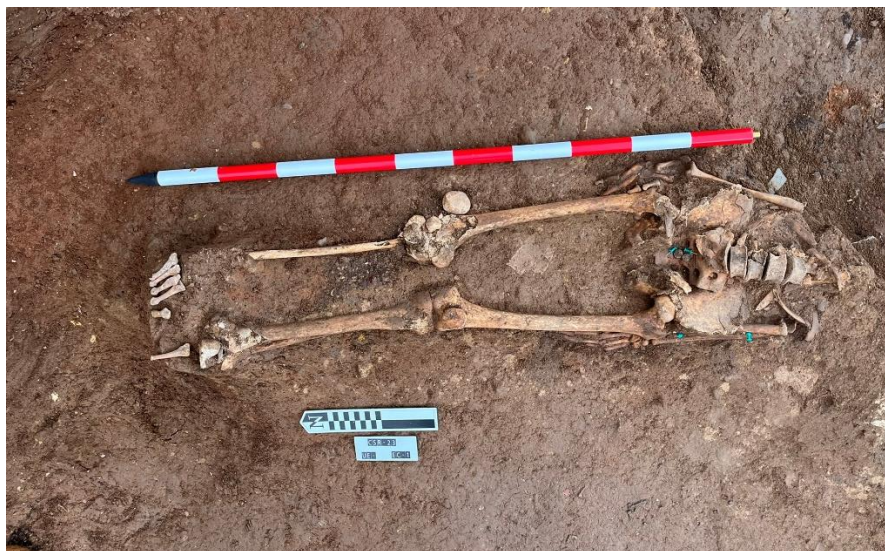
Individuo 1 (I-1). Documentación en campo. Se encontraba alterado y destruido por alteraciones posdeposicionales posteriores, en concreto por una de las zanjas basurero posteriores de finales del s. XX