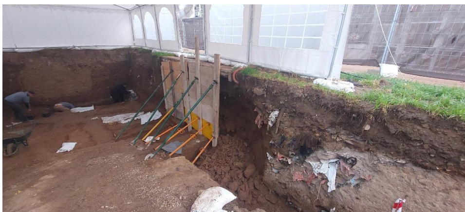
Entibado del perfil oriental del sondeo.

Por motivo de seguridad, debido a la inestabilidad de los perfiles resultantes tras la ejecución del sondeo, nos hemos visto obligados a realizar tareas de protección con el entibado de las paredes para evitar desprendimientos y hundimientos.