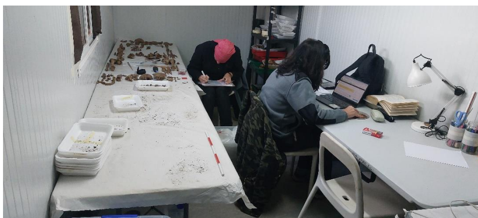
Diferentes imágenes de los trabajos que se realizan en laboratorio y gabinete