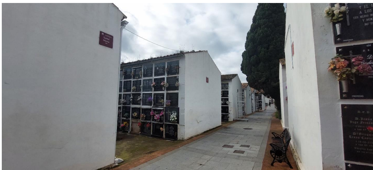
Imagen actual de los Cuadros de San Martín, San Benito y Santa Marta