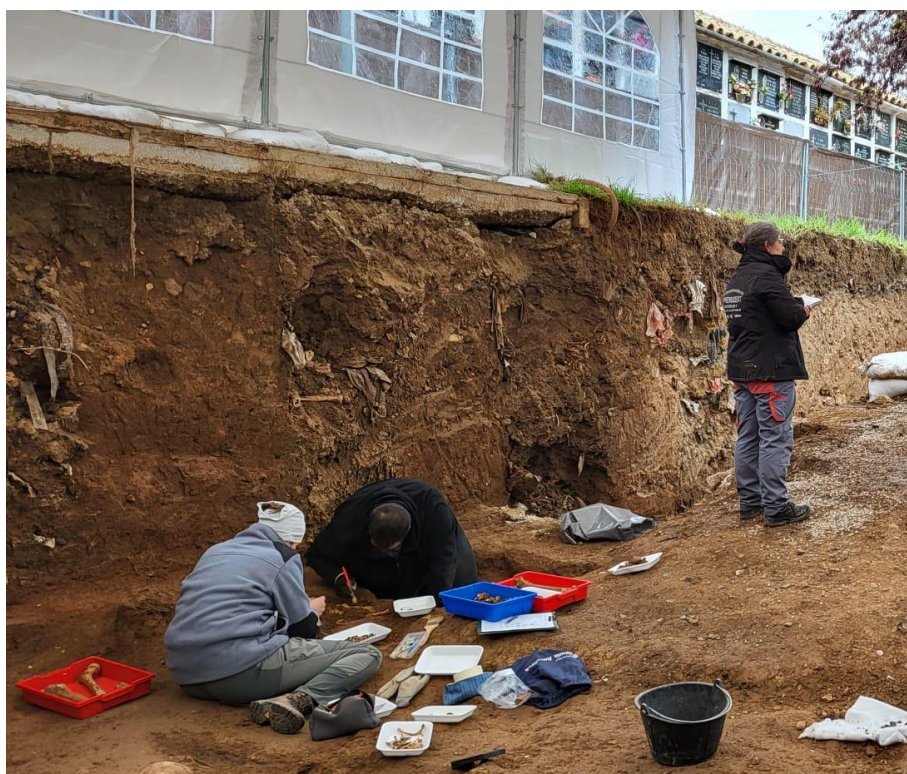
Proceso de exhumación de los restos.

Posteriormente los restos son trasladados al laboratorio de campo, habilitado con este fin, para la realización de un estudio preliminar, con el objetivo de obtener unas conclusiones básicas que ayuden a la posible identificación. En este sentido se realiza un perfil biológico que nos ayuda a hacer una primera criba de los restos, teniendo ya un argumento sólido sobre la factibilidad de pertenecer o no a población represaliada. Por ejemplo, todos los enterramientos correspondientes a párvulos o adolescentes son descartados, así como aquellos que, por franja de edad, por ejemplo, seniles, sabemos que no corresponden con víctimas.