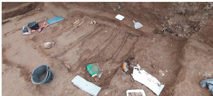
Excavación y delimitación en planta de los enterramientos.

Por motivo de seguridad, debido a la inestabilidad de los perfiles resultantes tras la ejecución del sondeo, nos hemos visto obligados a realizar tareas de protección con el entibado de las paredes para evitar desprendimientos y hundimientos.