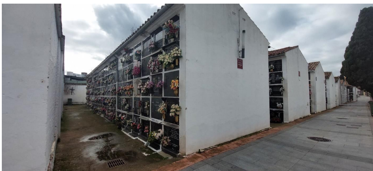
Imagen actual del cuadro de Santa Leocadia donde previsiblemente se situaría la Fosa Común en uso en los primeros momentos tras el golpe militar de 1936

Igualmente aparecen otros registros en el cuadro de S. Isaac. Se trata de un cuadro destinado a párvulos donde se depositan los restos de los niños que murieron víctimas de bombardeos.