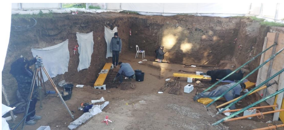
Imágenes de los trabajos de excavación sobre plataformas realizados con chapas de andamios y bloques de hormigón.