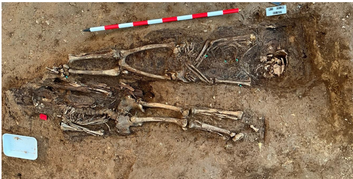
Imagen del Depósito múltiple (I-6 y 7). Documentación en campo.

Imágenes de campo y laboratorio del Individuo 3 (I-3) tanto de campo como de laboratorio