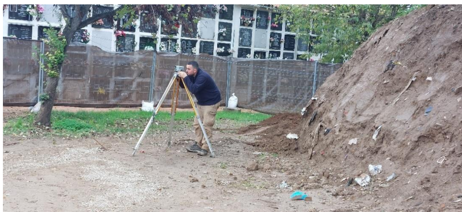
Trabajos de documentación topográfica