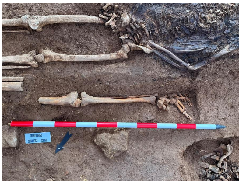
Imágenes de amputaciones documentadas y exhumadas en la fosa