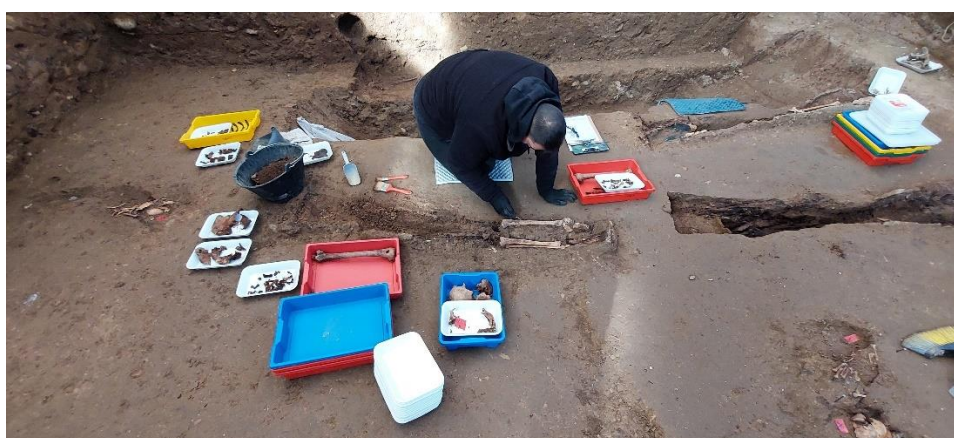
Proceso de exhumación de los restos.