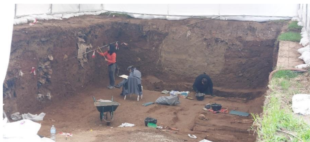
Trabajos de documentación planimétrica