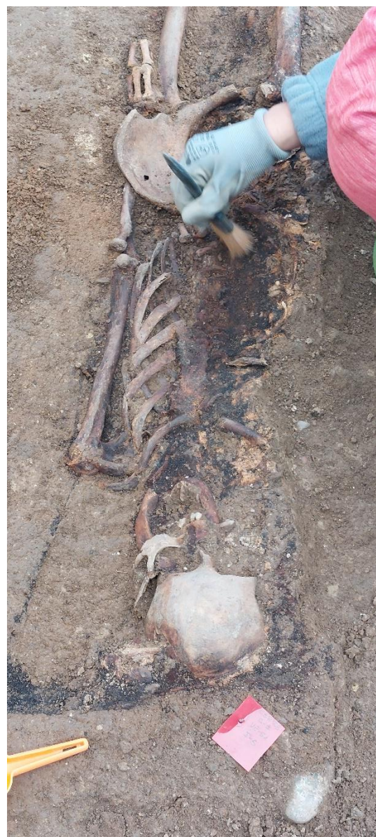
Proceso de excavación e intervención Directa sobre los restos.