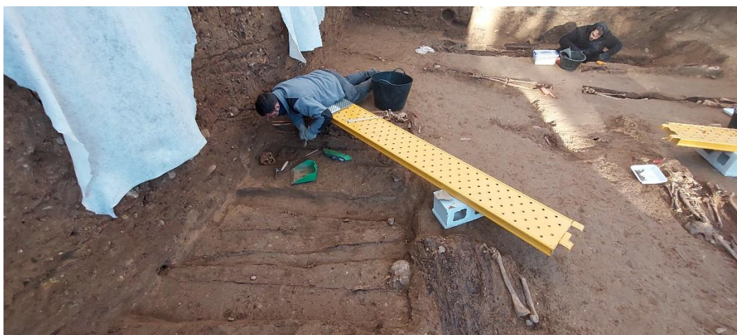
Excavación en planta de un grupo de inhumaciones que fueron depositadas a la vez en la fosa.