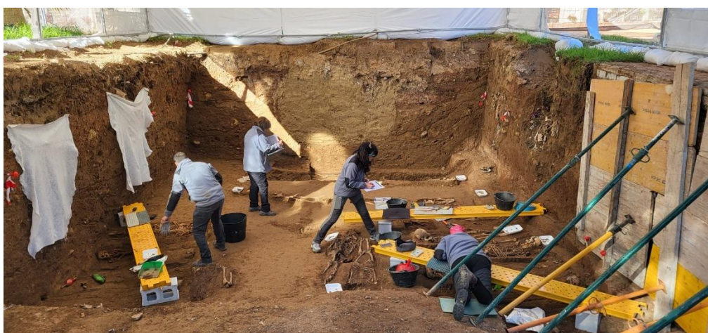
Trabajos de excavación y documentación arqueológica