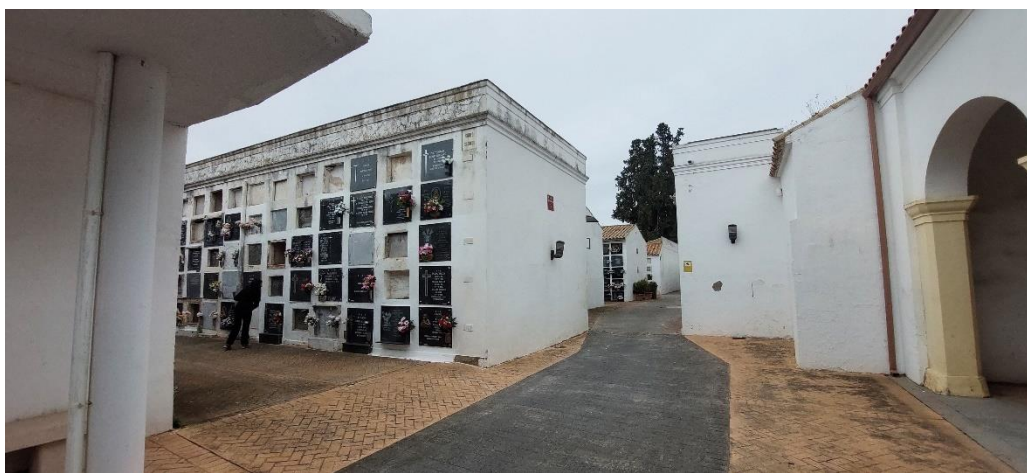
Imagen actual del Grupo Segundo de bovedillas

El uso de la bovedilla funcionaba igual que para las sepulturas de suelo si no se renovaban tras pasar los 10 años de uso, si bien muchos nichos eran comprados a perpetuidad. Hemos podido comprobar que actualmente algunas de estas bovedillas aún mantienen las lápidas que indican la ocupación de fallecidos de esos momentos, si bien la mayoría de las que se conservan corresponden con soldados correspondientes al bando sublevado ya que a ellos se les concedía gratuitamente y a perpetuidad. Hemos podido documentar una que aun contiene los restos de una víctima, corresponde con la tumba de Manuel Tarazona Anaya, Capitán de la Guardia de Asalto muerto el 13 de agosto de 1936. Según consta en la inscripción del Registro Civil "Paso por las armas en el Cuartel del Marrubial a las 11 horas"