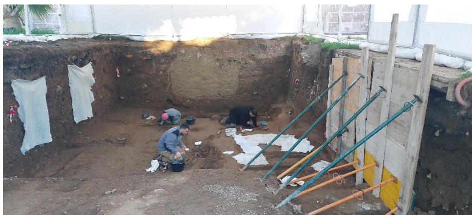
Continuación de los trabajos de excavación tras asegurar el perfil.