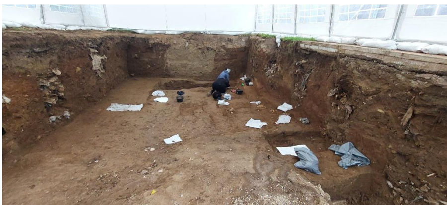
Comienzo de la excavación con medios manuales del sondeo