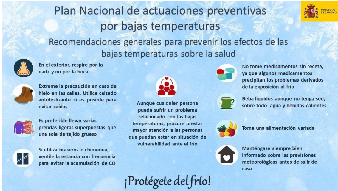
Ilustración 4. Infografía recomendaciones generales para prevenir los efectos de las bajas temperaturas sobre la salud