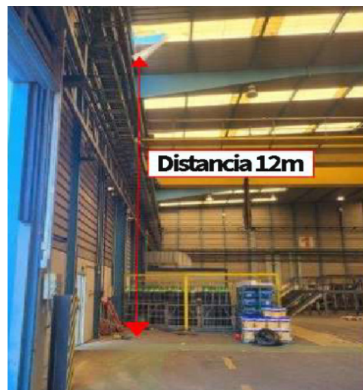
Altura y la placa traslúcida por donde se cae.

Una persona competente debe dirigir el trabajo en altura y vigilar que se ejecuten las medidas propuestas en la planificación preventiva.