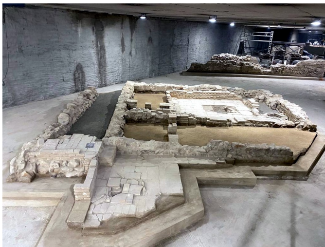
Metro Málaga restos arqueológicos

Finalmente, el año 2021 se ha procedido al traslado, colocación y consolidación de los restos arqueológicos encontrados durante las obras a su ubicación definitiva en el futuro espacio museístico bajo la avenida de Andalucía.