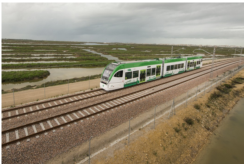
TramBahía pruebas móviles

En febrero de 2021, comenzaron los trabajos de actualización tecnológica y puesta en marcha del sistema de radio GSM-R para la comunicación tren/PCC/supervisores. Igualmente, fruto de la estrecha y fructífera cooperación con ADIF, RENFE y la Agencia Estatal de Seguridad Ferroviaria (AESF) en todos los asuntos de coordinación y autorizaciones, en abril de 2021 se lograba la homologación de la AESF correspondiente a la habilitación de los talleres y cocheras de Chiclana como instalación de mantenimiento del material rodante ferroviario. En junio el Consejo Rector de la AOPJA autorizó el inicio del expediente de contratación para la adjudicación del contrato de servicio público para la prestación de los servicios ferroviarios con Renfe Viajeros, una vez se concluyó la definición y coordinación del documento contractual y sus anejos.