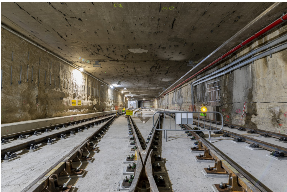
Metro Málaga Atarazanas

En 2021 se ha seguido acelerado los ritmos de producción de los dos tramos en construcción (Renfe – Guadalmedina y Guadalmedina – Atarazanas), duplicándose la certificación, y se ha procedido a la recuperación de diferentes vías públicas ocupadas por las obras. Los últimos espacios en superficie ocupados se han recuperado en julio (Armengual de la Mota) y en agosto de 2021 (Plaza de la Solidaridad).