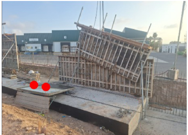
En color rojo se representan donde estaban los trabajadores.

El izado se realizó con cables anclados a un solo panel, lo que contribuyó al desprendimiento. La caída del panel provocó que un trabajador falleciera al quedar atrapado completamente y otro sufriera lesiones en el cuerpo.