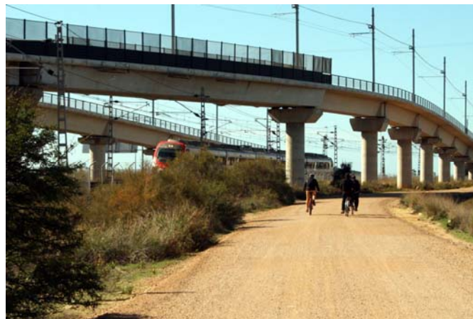
Salto del Carnero