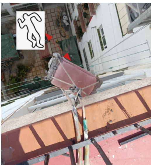
Distancia desde la silla al suelo.